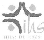
COLEGIO BLANCA DE CASTILLA Spain